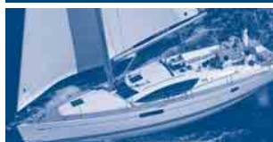
Sun Odyssey 45 DS Performance