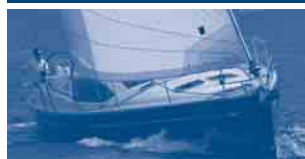
Sun Odyssey 50 DS