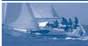
Sun Odyssey 45 DS