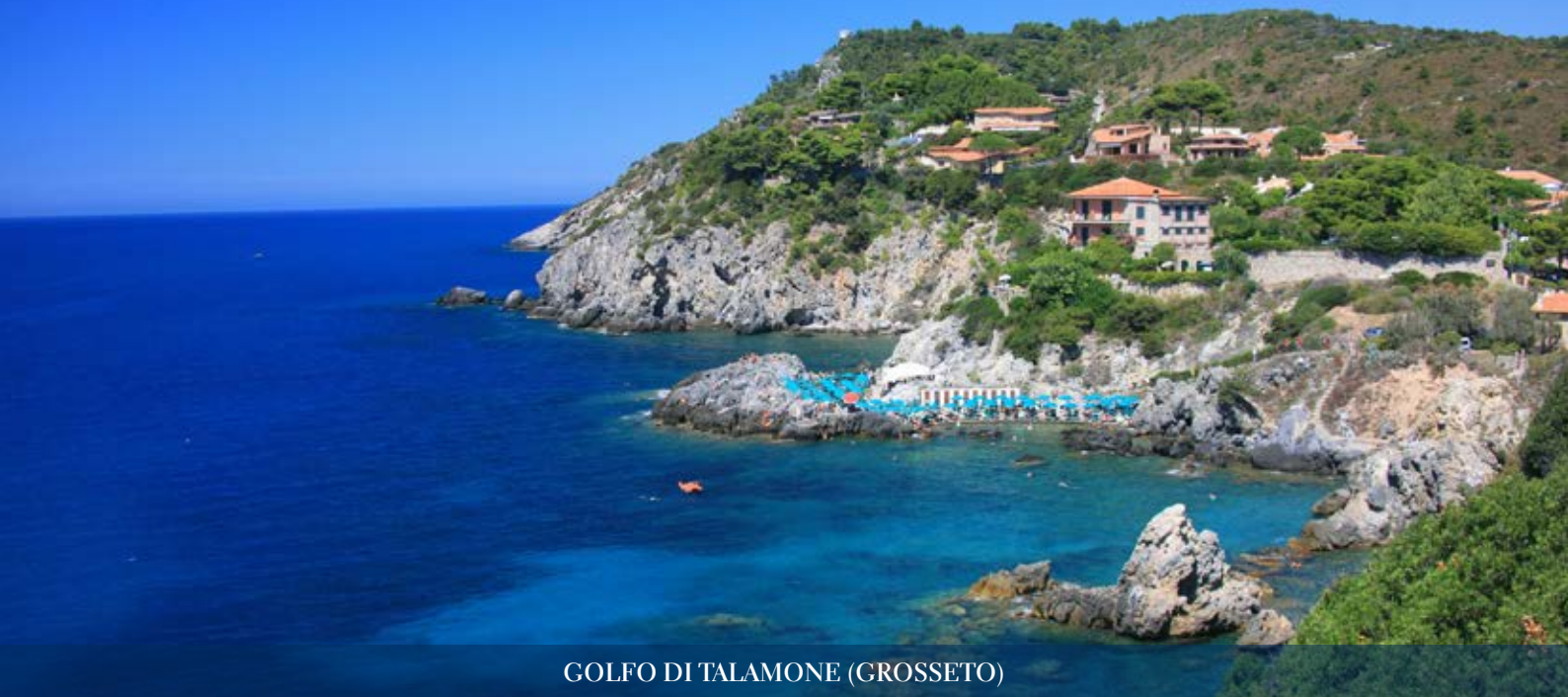
GOLFO DI TALAMONE (GROSSETO)