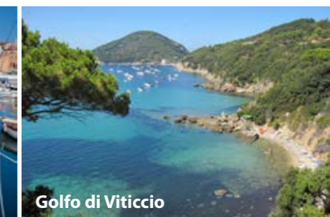
Golfo di Viticcio