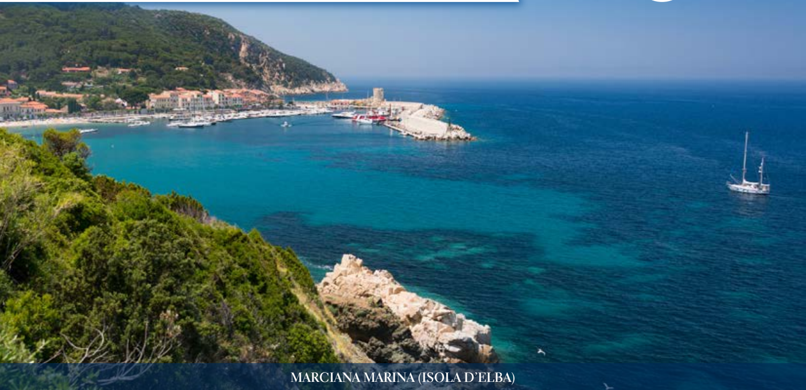
MARCIANA MARINA (ISOLA D'ELBA)