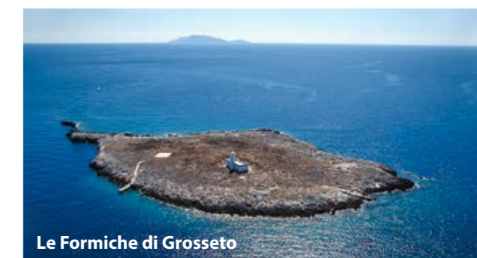
Le Formiche di Grosseto

Salpiamo per una bella veleggiata verso Porto Azzurro, ma facciamo tappa alle Formiche di Grosseto, tre isolotti a circa 15 miglia da Porto Santo Stefano, veri e propri paradisi naturali incontaminati, ricchi di reperti archeologici. Solo 18 miglia ci separano dalla Marina di Scarlino, quindi Porto Azzurro è località migliore per trascorrere l'ultima notte.