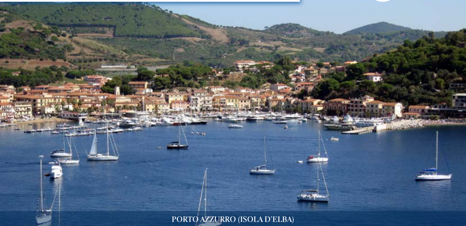
PORTO AZZURRO (ISOLA D'ELBA)