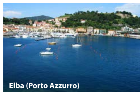
Elba (Porto Azzurro)