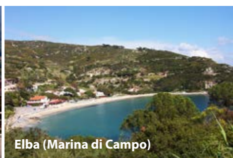
Elba (Marina di Campo)