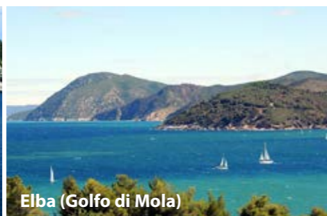
Elba (Golfo di Mola)