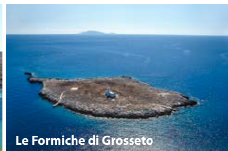
Le Formiche di Grosseto