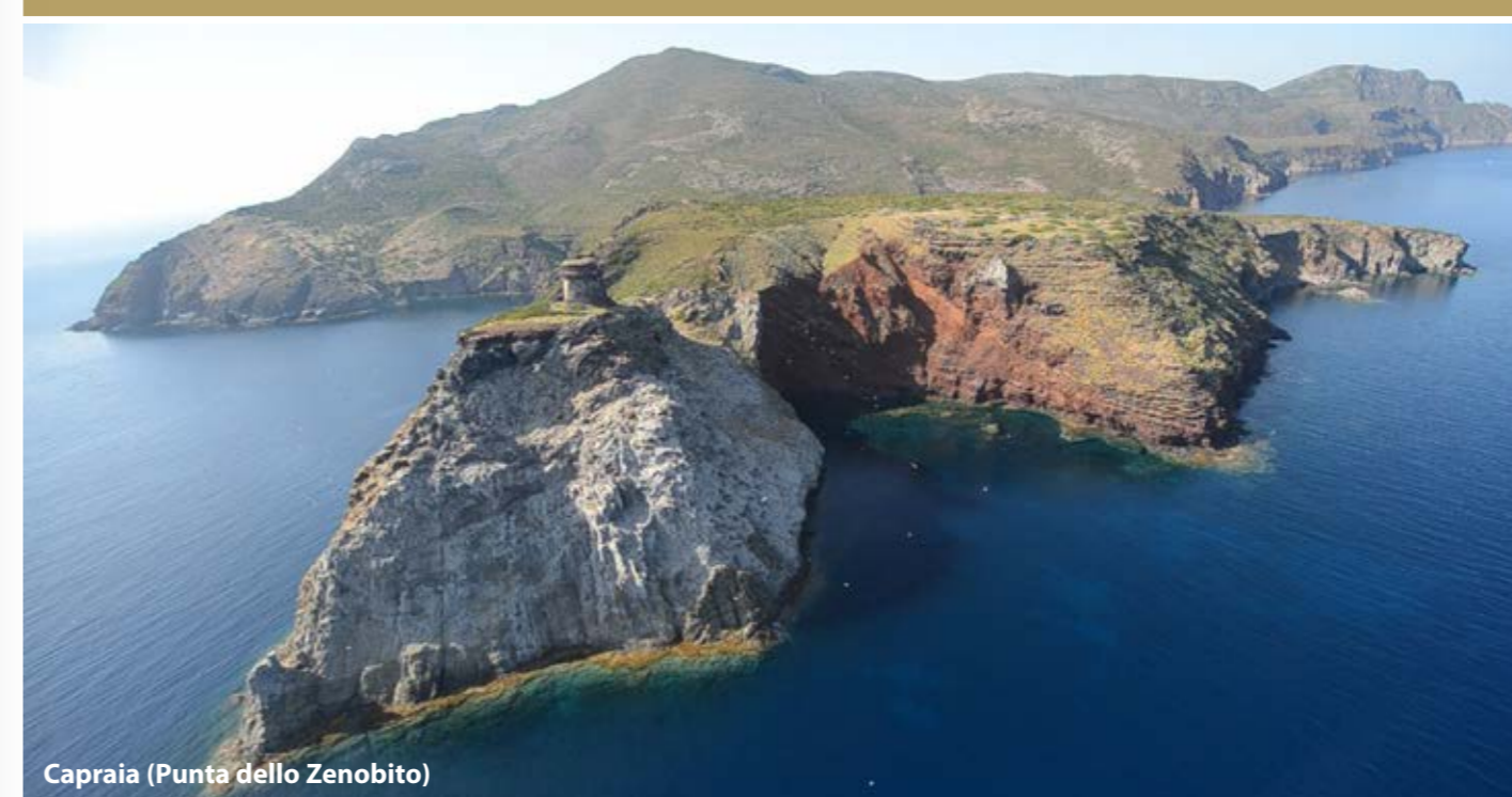
Capraia (Punta dello Zenobito)