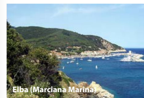
Elba (Marciana Marina)