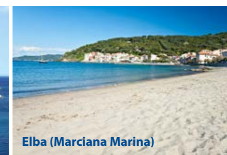
Elba (Marciana Marina)