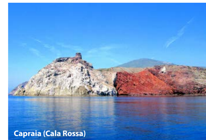
Capraia (Cala Rossa)

Sicuramente nei ricordi di questa vacanza in barca a vela, rimarranno impressi i suggestivi paesaggi delle isole dell'Arcipelago Toscano e il suo mare cristallino.