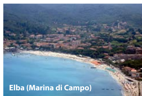
Elba (Marina di Campo)