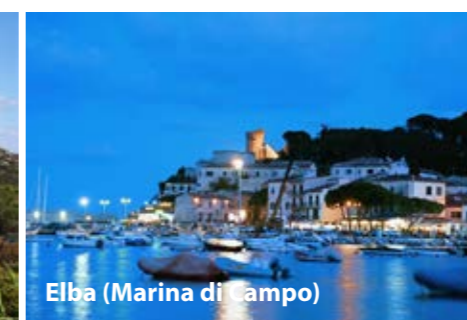
Elba (Marina di Campo)