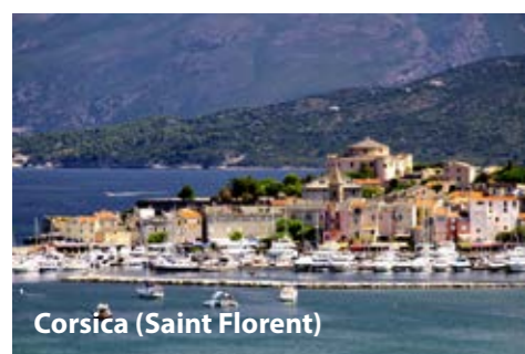
Corsica (Saint Florent)