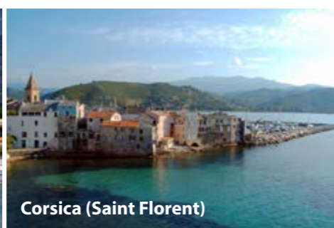
Corsica (Saint Florent)