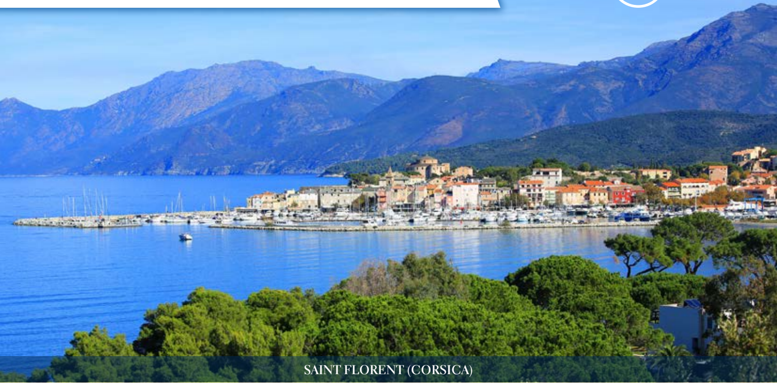
SAINT FLORENT (CORSICA)