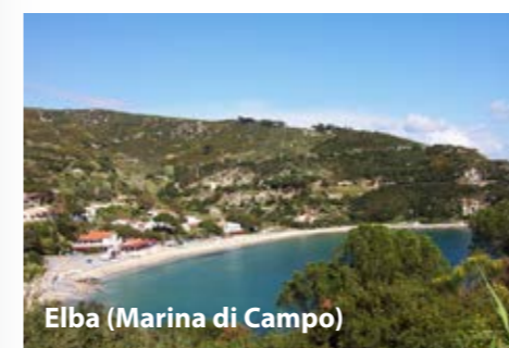
Elba (Marina di Campo)