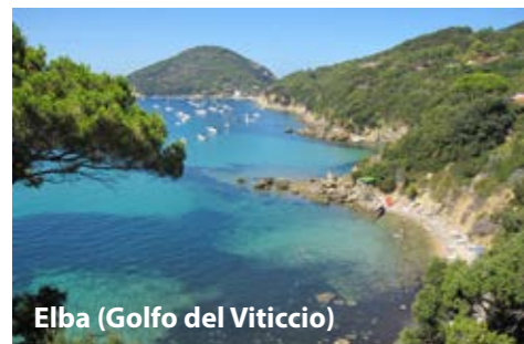
Elba (Golfo del Viticcio)