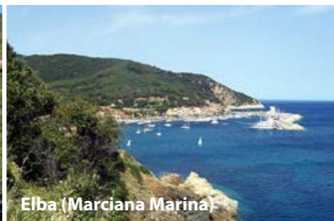
Elba (Marciana Marina)